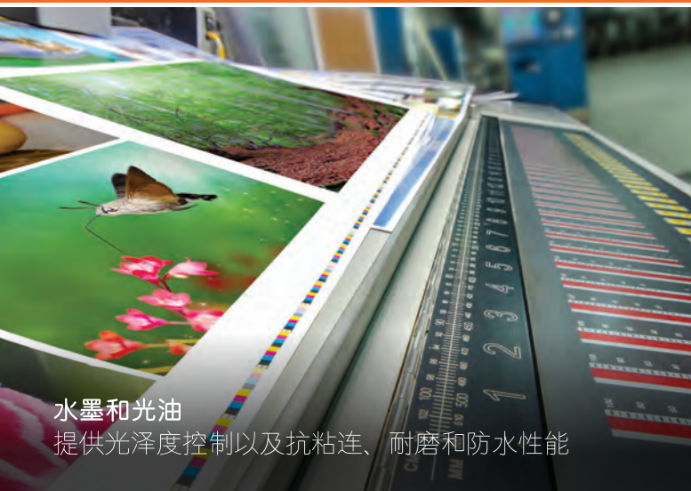
水墨和光油 提供光泽度控制以及抗粘连、耐磨和防水性能