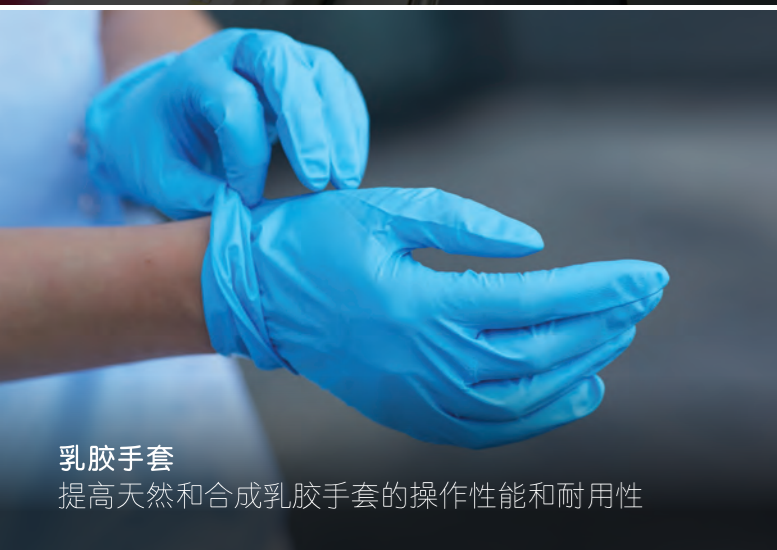
乳胶手套 提高天然和合成乳胶手套的操作性能和耐用性