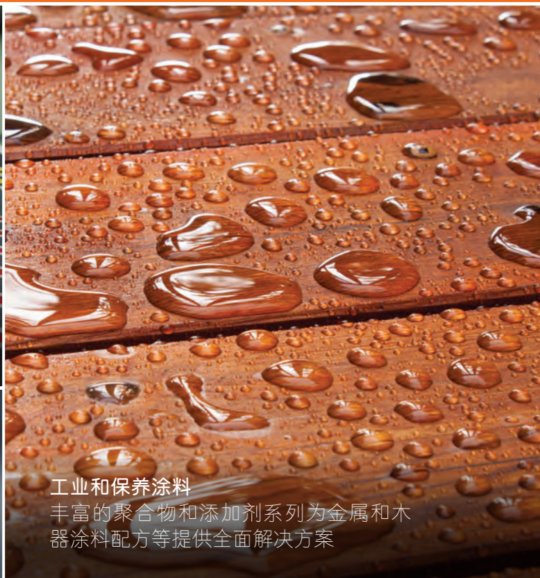
工业和保养涂料 丰富的聚合物和添加剂系列为金属和木器涂料配方等提供全面解决方案