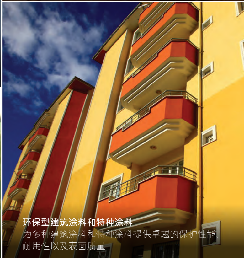
环保型建筑涂料和特种涂料 为多种建筑涂料和特种涂料提供卓越的保护性能、耐用性以及表面质量